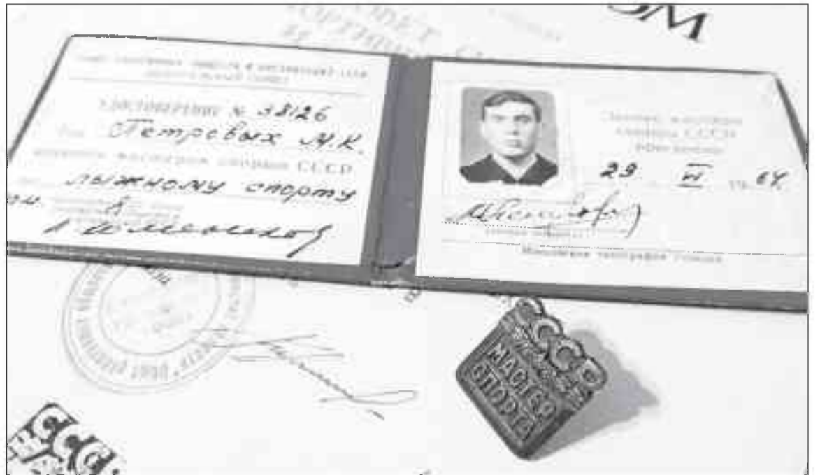
Так выглядит первое в Краснотурьинске удостоверение мастера спорта СССР по лыжным гонкам

- Из подвала на Фрунзе, 57 мы переехали в домик ДСО «Труд» Богословской ТЭЦ за Турьей, который сейчас является лыжной базой КЛПУ. Здание было передано школе в 1968 году. Туда переехали все снаряжение, там готовились к тренировкам и соревнованиям. Когда места в нем не стало